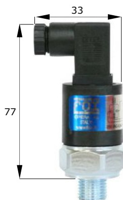
F3/M2 esecuzione execution