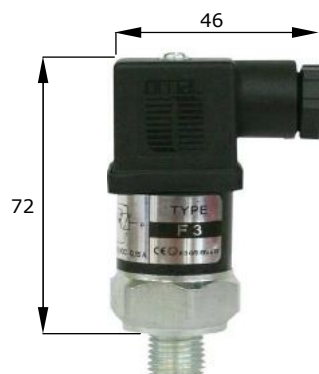
F3/M3 esecuzione execution